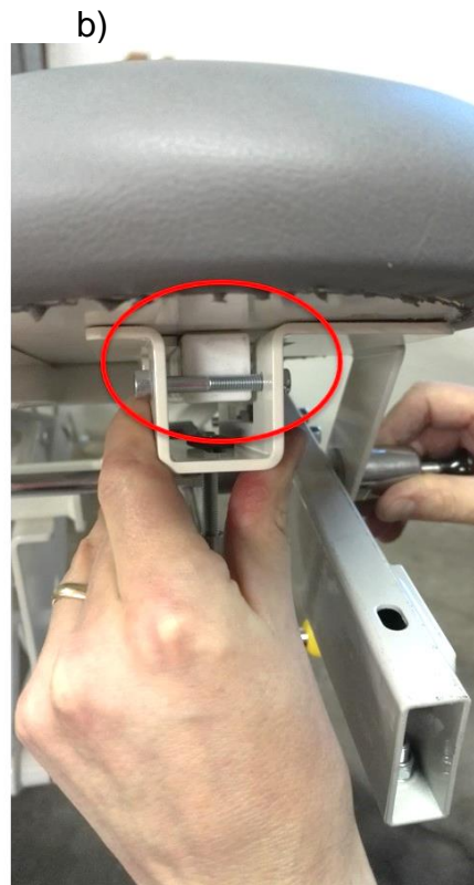
Kuva 4: Lukituslaitteen asennus a) vetonupin tappi painettuna runkoputkea vasten b) lukituslaite vasten istuinosan runkoputkea (muovitulppa)