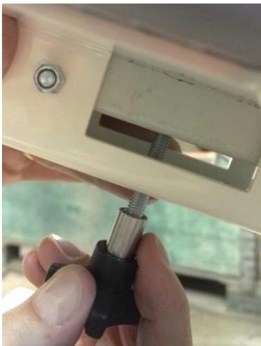
Kuva 6: Kiristyspala pujotettuna reikään. Kiristys kiertämällä tähtinuppia.

Vaihe 4: Kiristyspala pujotetaan reikään suoristamalla tappi. Kiristä tähtinupista (Kuva 6)(Kuva 1 (4)).