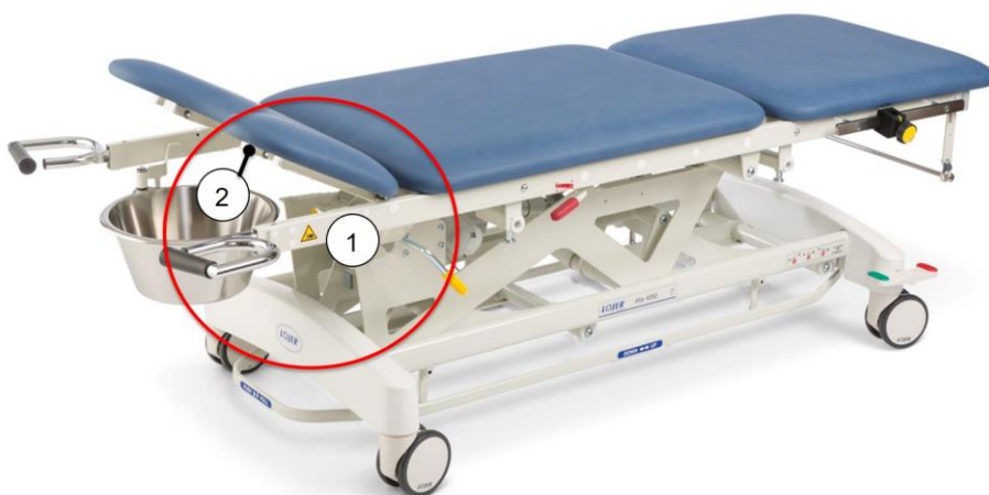
Kuva 2: Lukituslaitteen asennuskohta

Lukituslaite asennetaan pöydän runkoon jalkopäästä katsottuna oikealle puolelle (eri puolelle kuin gynemalja). Asennuskohta alla (Kuva 2).