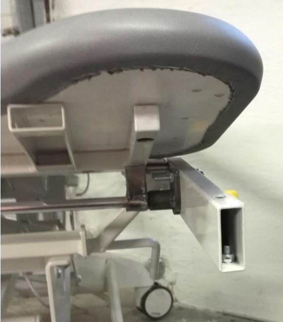
Kuva 3: Gyneosa käännettynä ylimpään asentoon

Vaihe 1: Nosta istuinosa (gyneosa) ylimpään asentoon (Kuva 3).