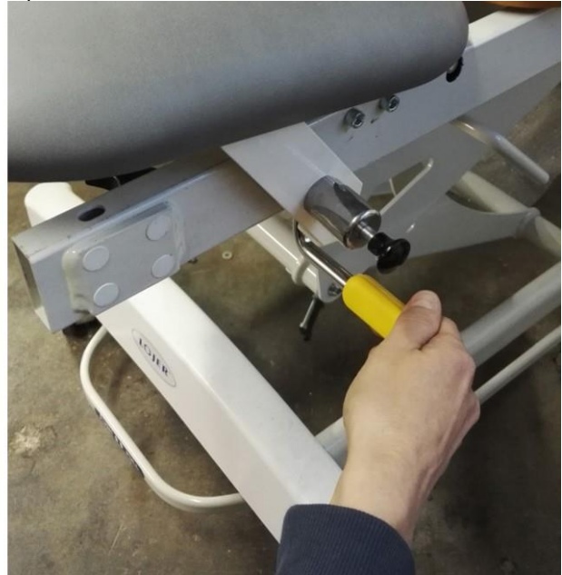
Kuva 7: Lukituslaitteen käyttö

Laskettaessa istuinosa (gyneosa) lukittuu alas paikalleen, kun vetonupin tappi naksahdaa runkoputken alle.